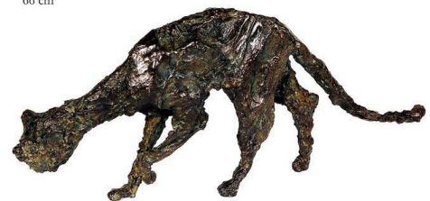
"Vieux chat" bronze 66 cm